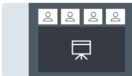
Mise en page intelligente