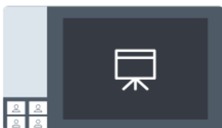
Centrer sur la présentation