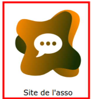
Site de l'asso